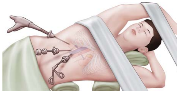
신장암의 복강경 수술

최근, 신장암은 수술의 대부분을 개복이 아닌 복강경 혹은 로봇을 이용하여 시행하고 있습니다. 복강경과 로봇은 복부에 3-5개의 작은 구멍을 통하여 수술을 시행하므로, 수술 후 통증이 적고, 미용상의 유리함도 있으며, 환자의 수술 후 스트레스도 적어 빠른 회복을 기대할 수 있습니다.