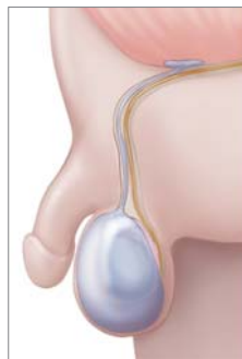
▶ 교통성 음낭수종