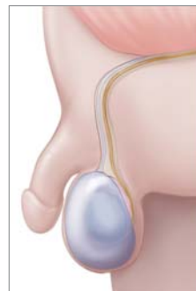
▶ 비교통성 음낭수종