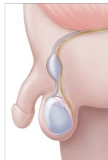
▶ 정삭 부위 음낭수종