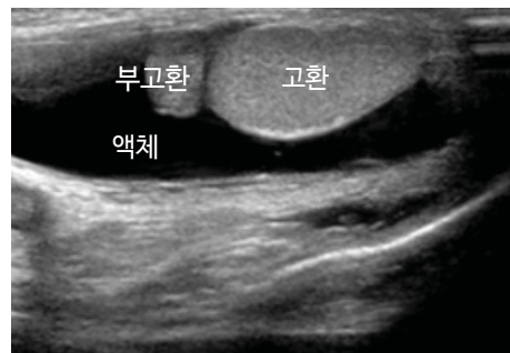
음낭초음파에서 음낭 내에 물이 찬 소견